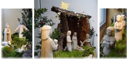
Crèche exposée dans la vitrine d'un commerce de Mauves

Pour la troisième année consécutive, les collégiens de l'aumônerie des collèges publics ont bâti des crèches, une pour chaque clocher de notre Paroisse : « Nous avons créé une Crèche. Nous aimerions faire partager la joie de notre projet. On les a appelées les crèches de la « périphérie » car elles sont exposées dans des vitrines qui donnent sur la rue, ce qui permet à tous les passants, grands et petits, de les admirer ! ». Vous aussi, vous êtes