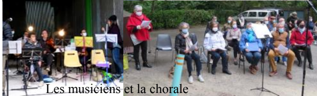
Les musiciens et la chorale