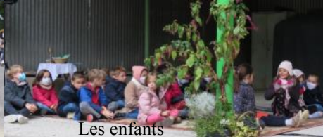
Les enfants Et leurs guirlandes