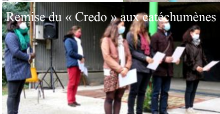
Remise du « Credo » aux catéchumènes